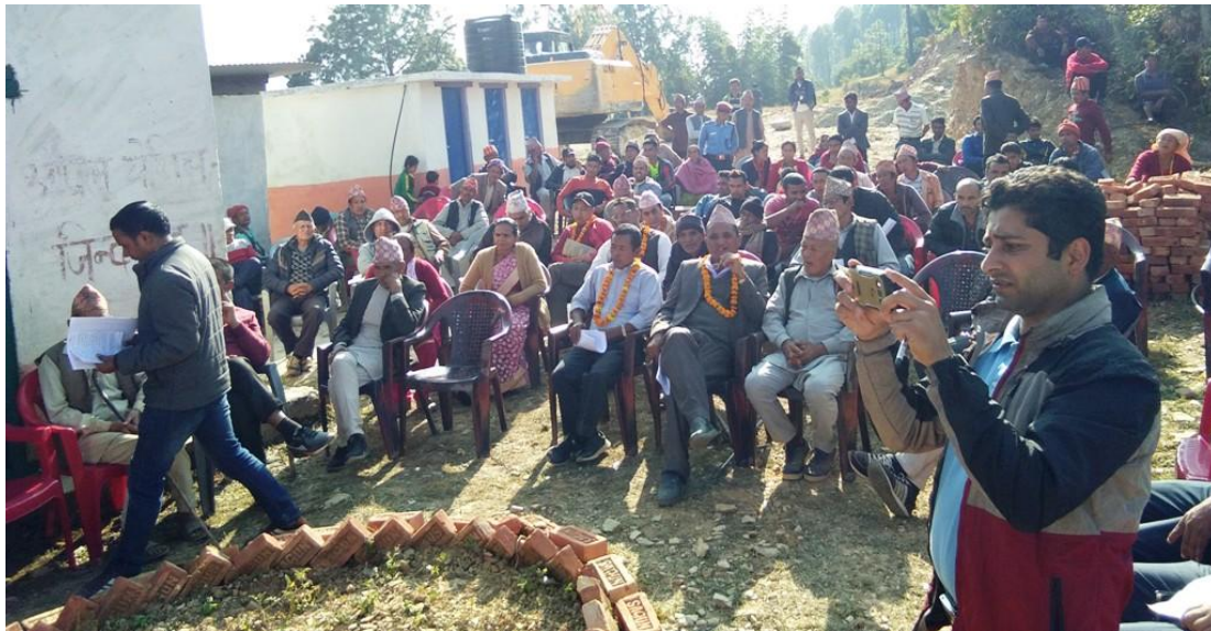
सार्वजनिक सुनुवाईका सहभागीहरु