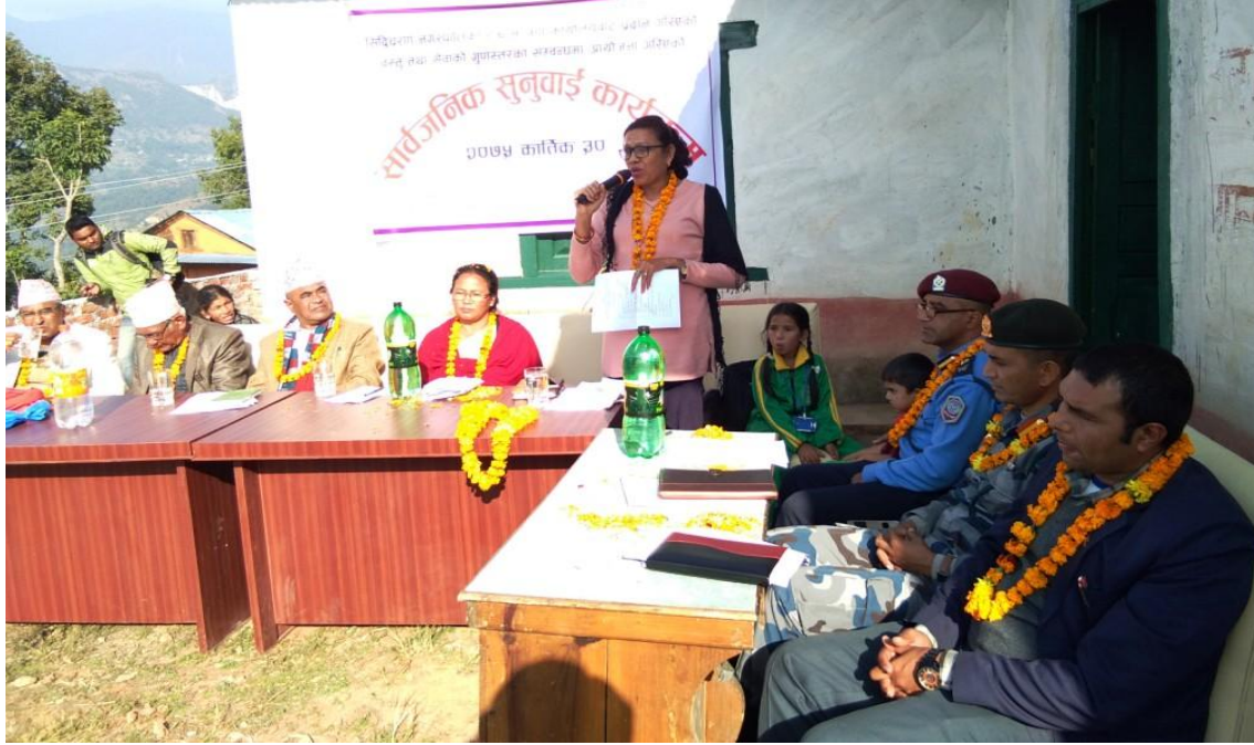
प्रमुख जिल्ला अधिकारी समापन मन्तव्यको क्रममा