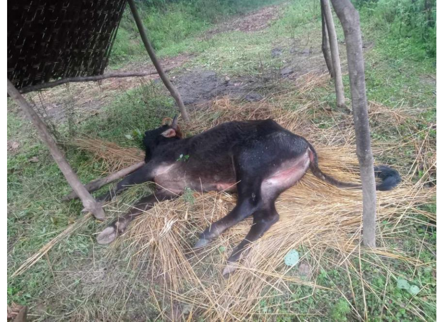
लम्फी स्किन रोगवाट ग्रसित गोरु